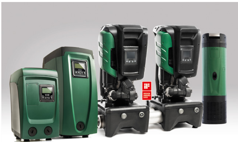
Typoszereg ESYBOX LINE – ESYBOX MINI3, ESYBOX, ESYBOX MAX, ESYBOX DIVER

Tradycyjne zestawy hydroforowe zajmują dużo miejsca, są wymagające podczas instalacji i często nieintuicyjne w użytkowaniu. ESYBOX to opatentowany, elektroniczny system hydroforowy z przetwornicą. Gwarantuje stałe ciśnienie w instalacji i pełną ochronę pompy, jednocześnie zapewniając kompaktową budowę i relatywnie niewielki rozmiar. ESYBOX jest ceniony przez użytkowników ze względu na łatwość obsługi, która idzie w parze z wysoką sprawnością i wydajnością. Urządzenie jest chętnie rekomendowane przez instalatorów, ponieważ odznacza się bardzo łatwą instalacją, podczas gdy bezprzewodowa technika pozwala na ustawienie zestawu składającego się nawet z 4